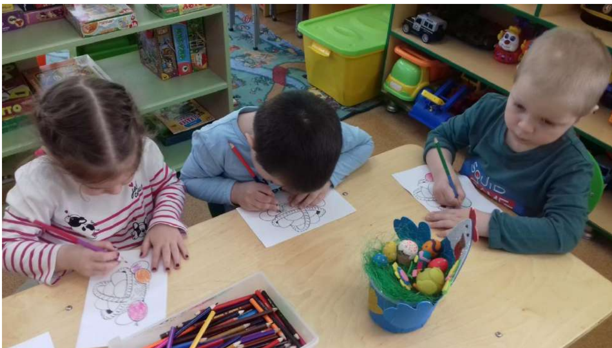
Рисунки карандашами «Яйца в корзине»