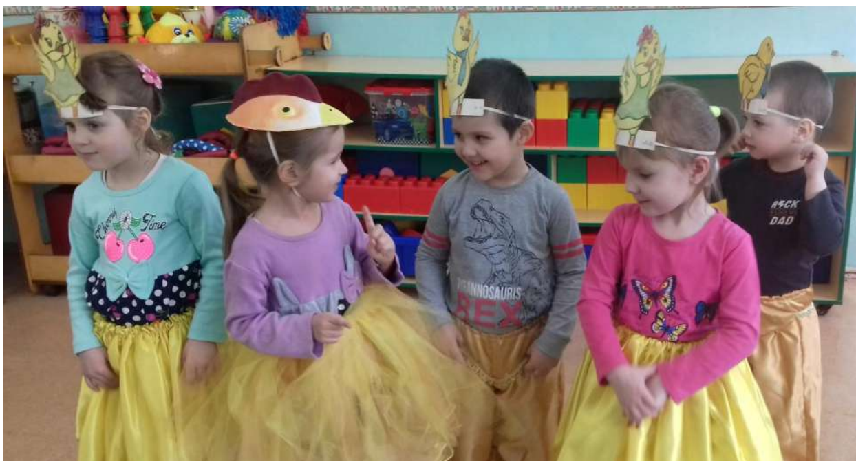
Малоподвижная игра «Вышла курочка гулять»