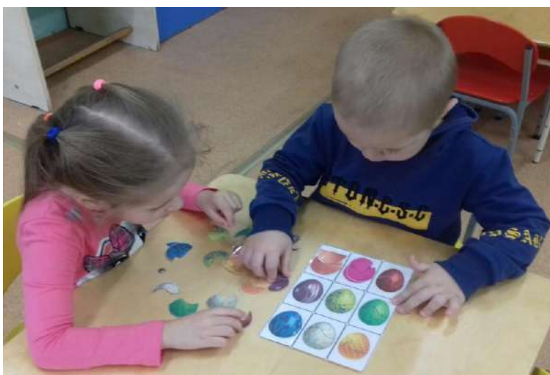
Дидактические игры «Собери яичко», «Собери яичко по цвету»