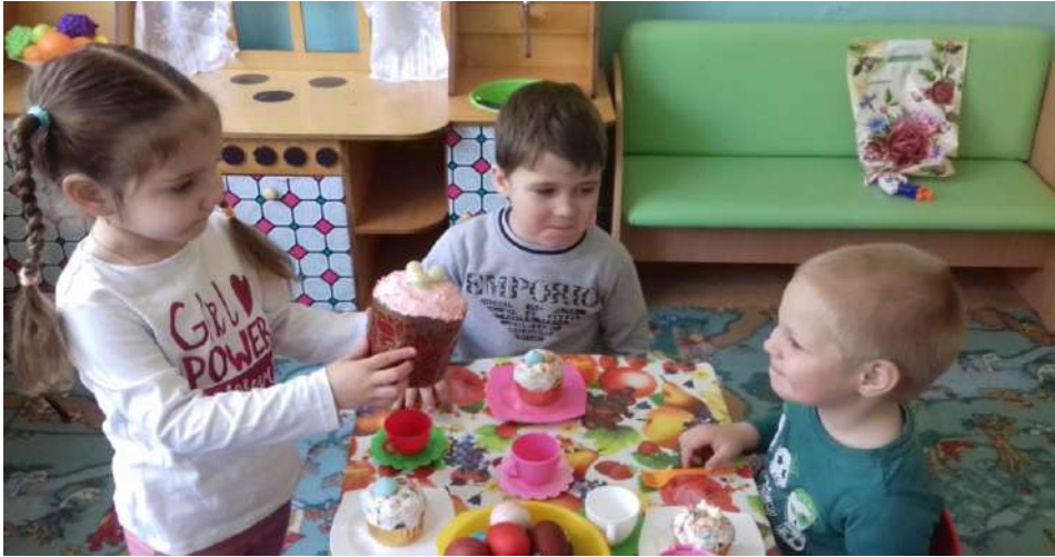
«Встречаем праздник Светлой Пасхи»