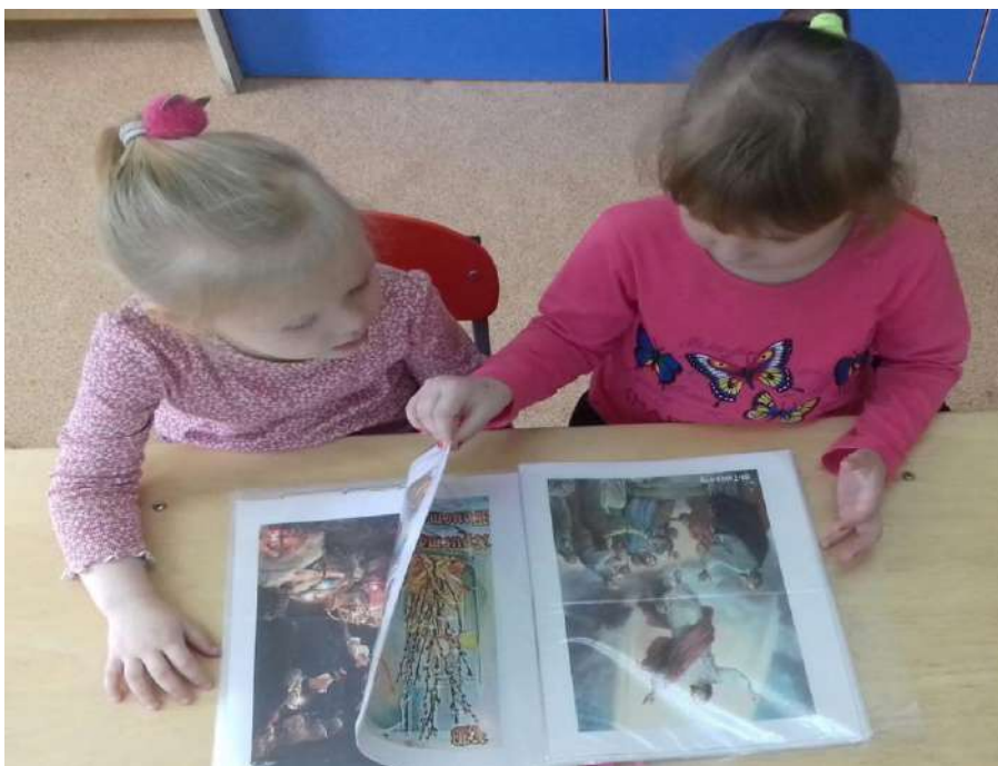
Рассматривание иллюстрационного материала «Светлая Пасха»